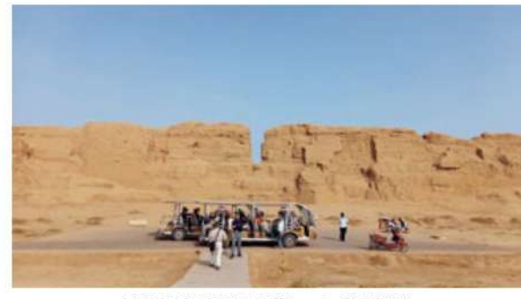
高昌古城の城壁と電動カート