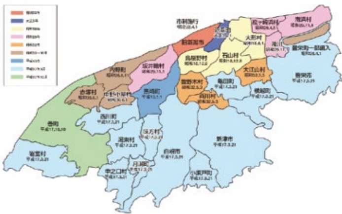
図：新潟市の合併概念図

この昭和の大合併を経た昭和四十四年度から、新潟市は「新潟市合併町村の歴史」編纂事業に着手します。この事業は、合併町村の資料収集と記録化、それに基づく史料編の刊行、新潟市を含む合併町村の近代の歩みを知る新聞報道の資料化を柱として進められ、十七年の歳月をかけて基礎史料集九巻、資料編五巻、通