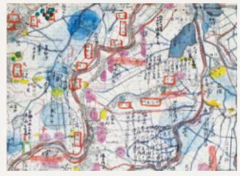
かつての潟などが書き加えられている(越後曾根駅周辺を拡大して表示)

た情報を空間的に整理するという金塚の地理的な思考がうかがえます。改めて本資料をみると、書き込まれている内容は、自然、歴史、民俗など多岐にわたり、金塚が幅広い関心のもとで調査を重ねていたことがわかります。地形だけに焦点を当てても、かつて存在した潟沼の位置・深さ、洪水時の破堤箇所、阿賀野川や信濃川の旧河道などが書き加えられています。 なお本資料の一部は「蒲原の民俗」が面白いというウェブページにおいて、現在の地形図と重ねて閲覧できるものが公開されています。(URL: https://jizoh.info/kanbara_no_minzoku/index.html ) (貞沼 良風 学芸員)