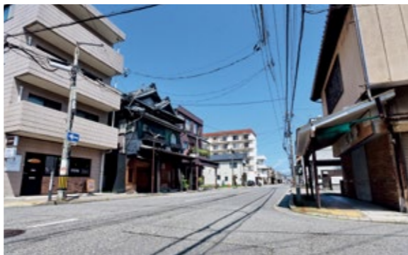
現在の本町通11番町