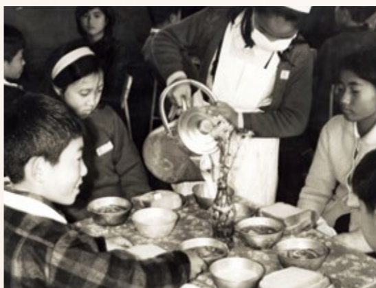
「ミルクの配膳」旧豊照小学校にて（昭和三十年代か）