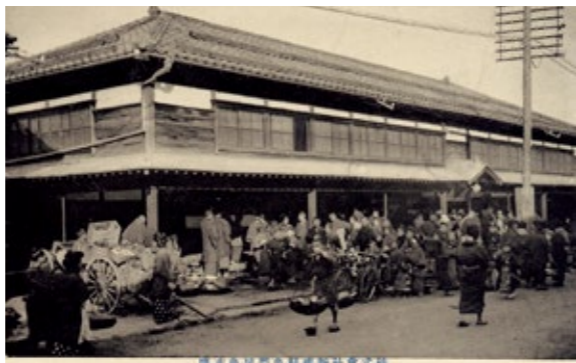
絵葉書 株式会社新潟鮮魚問屋魚市場