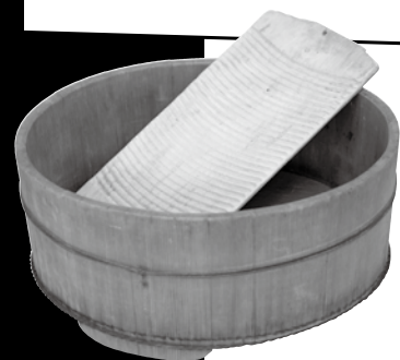
せんたくいた 洗濯板 あら おけ 洗い桶 (当館蔵)