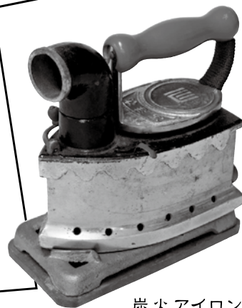
炭火アイロン (当館蔵)

会場：新潟市歴史博物館 1階たいけんの広場 定員：15名(先着順・事前申込不要)