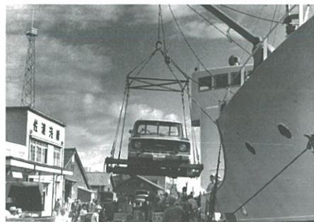
佐渡汽船なみじ丸に車を積む(昭和38年)

みなとびあの新事業、「みなとびあ歴史発見プロジェクト」の一環として、企画展「にいがた みなとの仕事 いまむかし」を開催します。