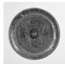
③三王山11号墳(三条市)出土の鏡