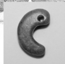
①葛蒲塚古墳(西蒲区)出土の勾玉