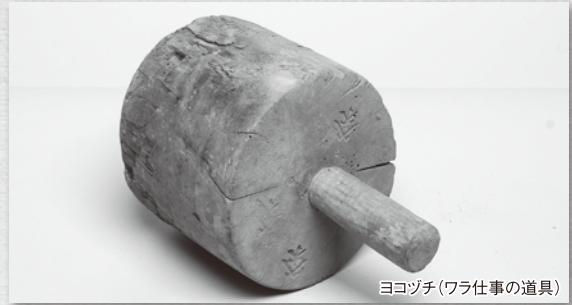
ヨコヅチ(ワラ仕事の道具)