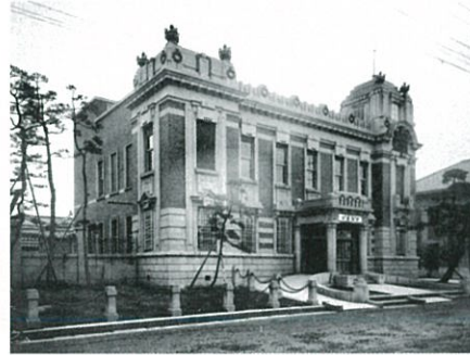
② 新潟銀行本店 (大正3年竣工)