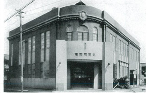
③ 新潟町役場 (昭和3年竣工)