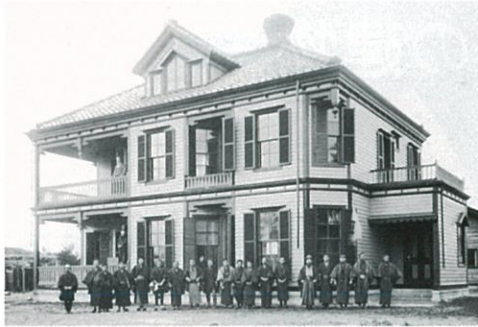
① 宣教師館 (明治22年ころ竣工)

本展を通じて新潟市の歴史を近代建築から感じ取っていただくとともに、現存する建物については歴史遺産として今後のあり方を考える機会にさせていただきたいと思います。