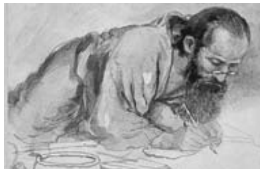
「絵を描く芳柳」(義松旧蔵作品群)

東京・横浜を主な活動拠点としていた「五姓田派」ですが、新潟に関する作品を多く残しています。このことは、明治期の新潟を考える上でも注目に値します。明治11年、義松は天皇の北陸巡幸に絵師として随行し新潟を訪れ、明治17年には、二世芳柳が新潟師範学校の図画教師として赴任しています。初代芳柳は、「新潟萬代橋図」(市指定文化財)の作者として知られていますが、新潟を数度訪れ、多くの名士の肖像画を描いており、幽香も新潟に関係する作品を残しています。この展覧会では、新潟に関わる作品や記録を展示し、新潟における五姓田派の活動をご紹介します。