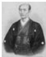
初代五姓田芳柳「新潟萬代橋図」(左) 「初代鍵富三作肖像」(右)