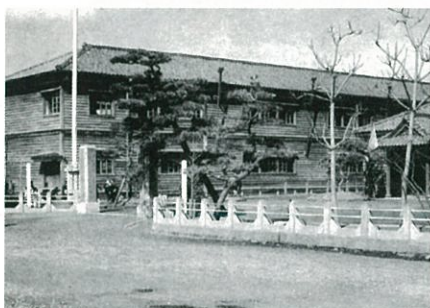
新潟尋常小学校 昭和7年

この企画展では、新潟市域を舞台に、地域と学校が深くかわっていた姿を紹介します。みなさんが学校を核とした地域社会のあり方を思い起し、地域における学校の役割を振り返り、今後の地域と学校のことを考えてくだされば幸いです。