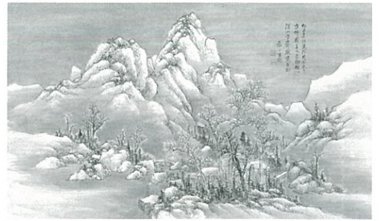
釧雲泉 「溪山雪霽図」

前期：平成19年2月10日(土)～3月4日(日) 後期：平成19年3月6日(火)～4月1日(日)