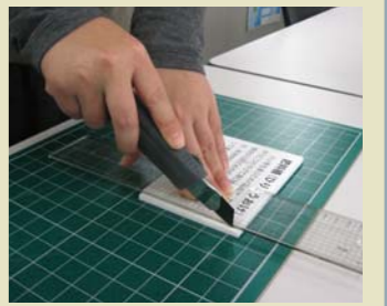
▲キャプションづくり

博物館を支えているモノや道具を紹介する新コーナー。記念すべき第1回は、「のりつきパネル」をご紹介します。