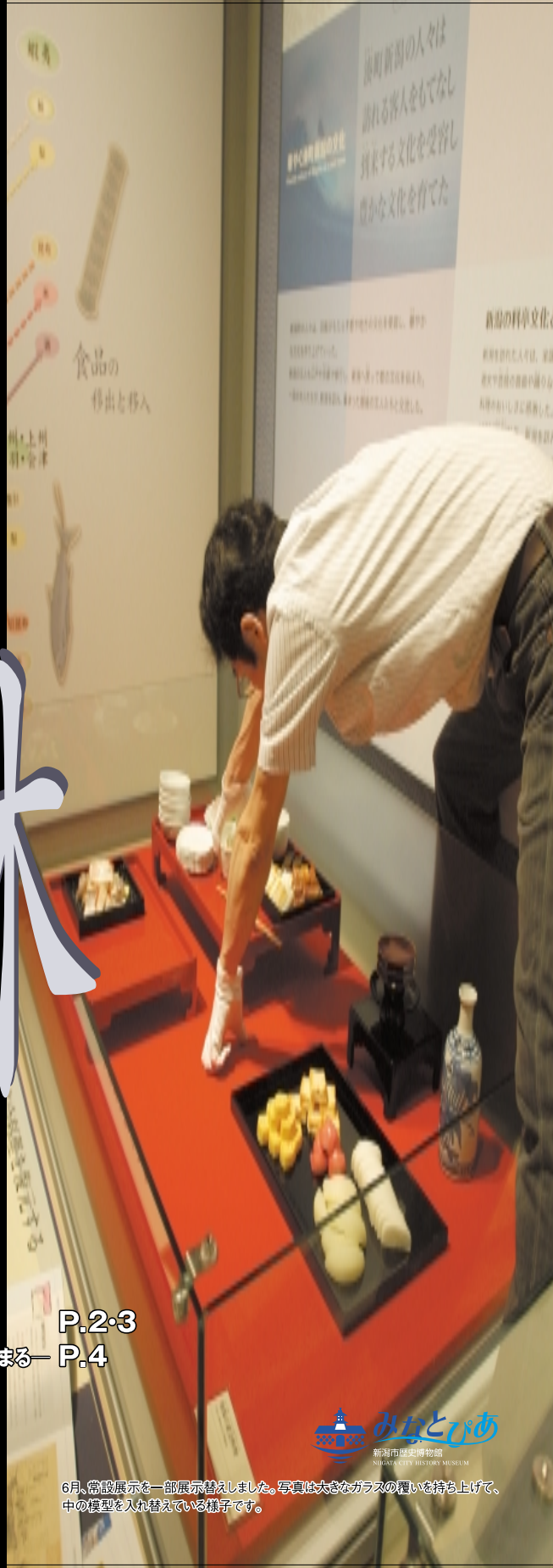
6月、常設展示を一部展示替えしました。写真は大きなガラスの櫃に入れ替えている様子です。